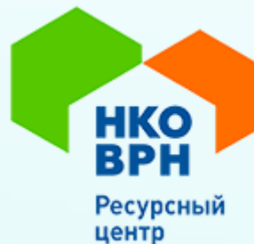
РЕСУРСНЫЙ ЦЕНТР ПОДДЕРЖКИ НКО ВОРОНЕЖСКОЙ ОБЛАСТИ