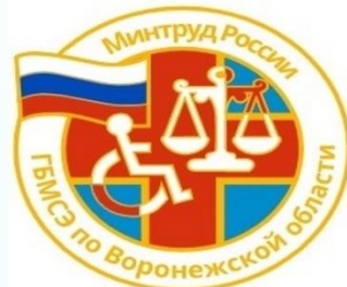
Главное бюро медико- социальной экспертизы по Воронежской области