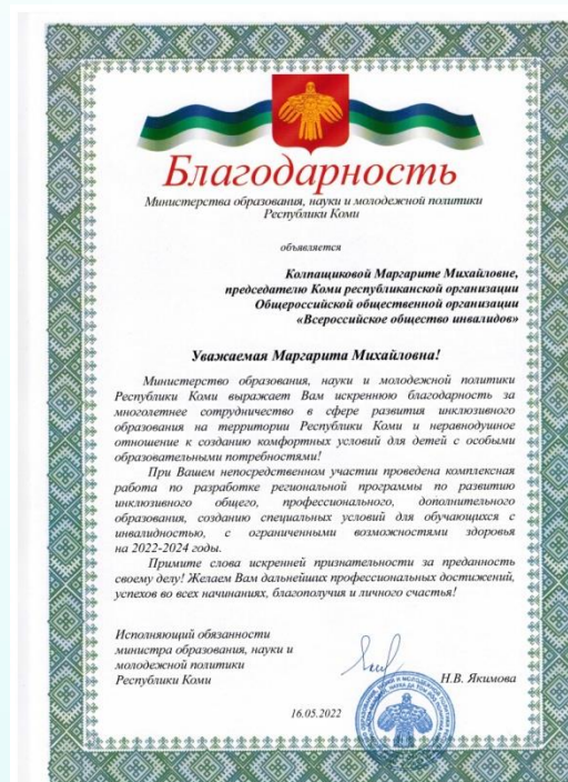
Министерство образования и науки Республики Коми