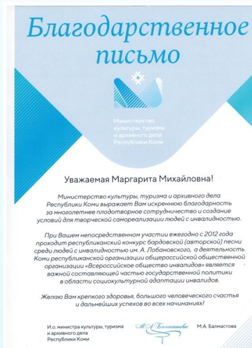
Министерство культуры, туризма и архивного дела Республики Коми