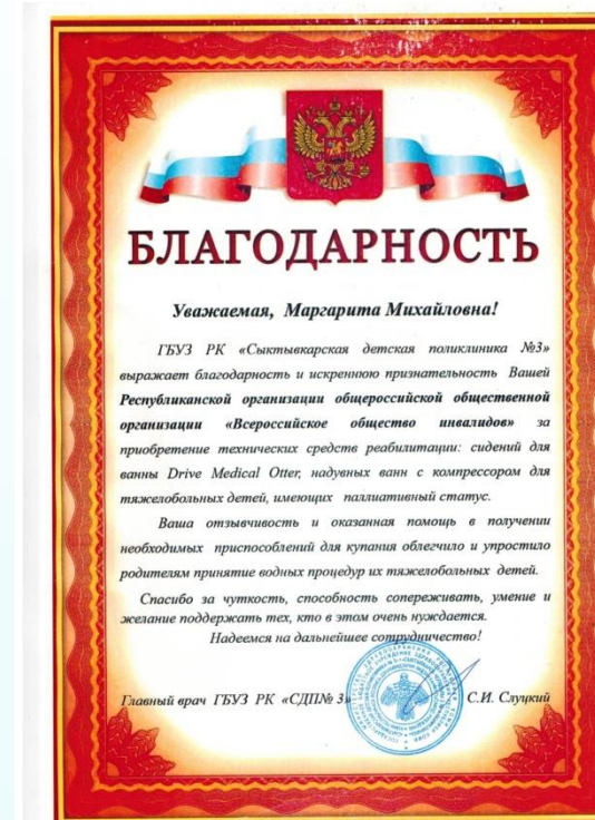
ГБУЗ РК "Сыктывкарская детская поликлиника №3"