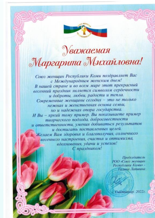
РОО "Союз женщин" Республики Коми